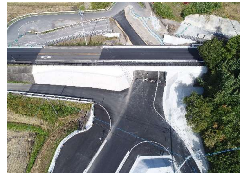
完成 (3県道の交差部)