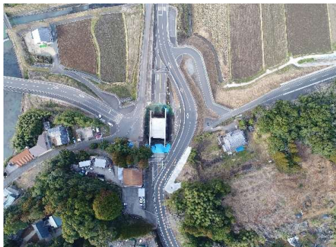
着工前 (全景) 上空より望む